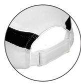
マジックベルト式