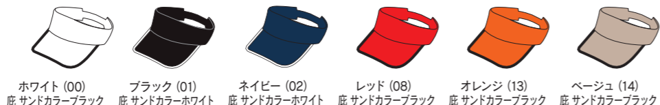
ホワイト (00) 底 サンドカラーブラック ブラック (01) 底 サンドカラーホワイト ネイビー (02) 底 サンドカラーホワイト レッド (08) 底 サンドカラーブラック オレンジ (13) 底 サンドカラーブラック ベージュ (14) 底 サンドカラーブラック