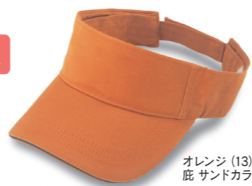
オレンジ (13) 底 サンドカラーブラック