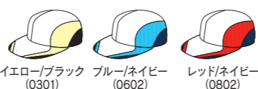
イエロー/ブラック (0301) ブルー/ネイビー (0602) レッド/ネイビー (0802)